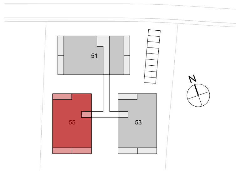
Übersicht Überbauung 1:1000