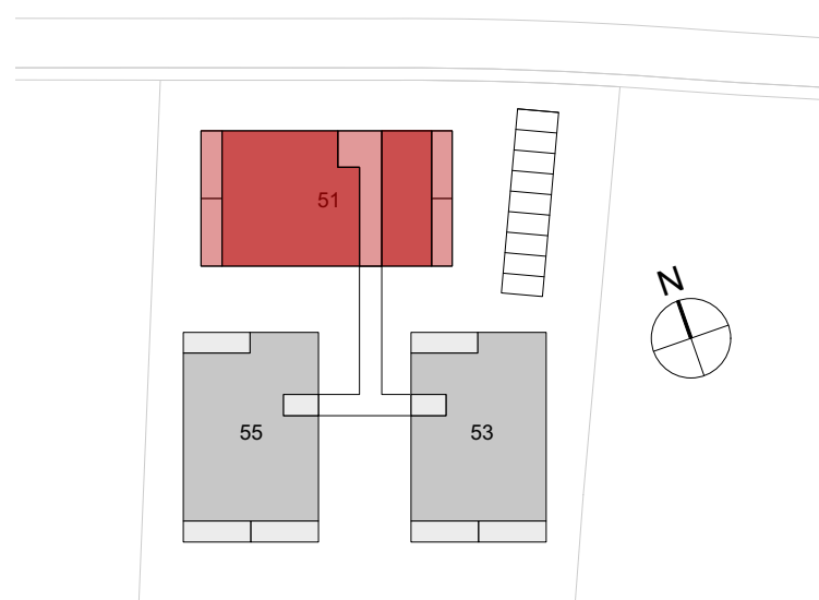
Übersicht Überbauung 1:1000

Nettowohnfläche 98.8m 2 Loggia 20.2m 2 Kellerraum UG 9.2m 2